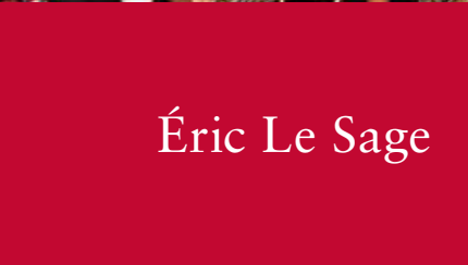
Éric Le Sage